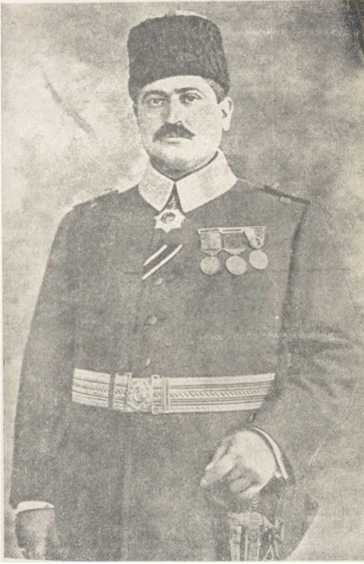
Talat Bey (Paşa) Dâhiliye Nazırı, sonra Sadrazam