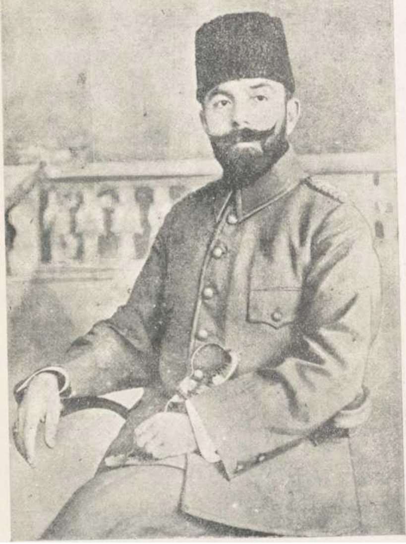
Cemal Paşa Bahriye Nazırı ve IV. Ordu K.

İttihat ve Terakki prensiplerine karşı başlıca cephe teşkil eden bu ademi merkezîyet fikrine türlü türlü iç ve dış cereyanları ve şahsi ihtiraslarda karıştı. Meşrutîyet'in koruyucusu olarak kalması lazım