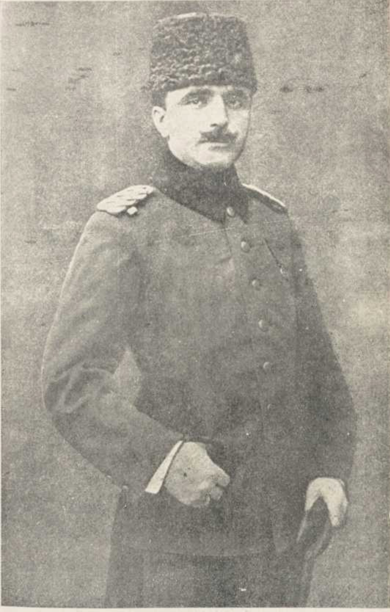
Enver Paşa Başkumandan Vekili ve Harbiye Nazırı