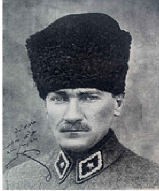
Mustafa Kemal ATATÜRK Müşir/Mareşal (1901) 1317-P.8 Selanik 1881-1938 (57) Mv